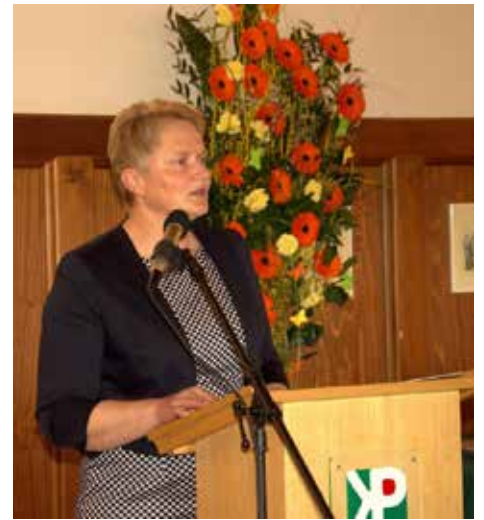
Županja je spregovorila o narejenem v lanskem letu

Ob prazniku občine Kozje je zbrane nagovoril tudi minister za gospodarski razvoj in tehnologijo Zdravko Počivalšek , ki je poudaril, da vedno rad prihaja v to občino, na katero ga vežejo marsikateri spomini, tudi ta, da je prav v tej občini v okviru Kmetijskega kombinata Šmarje pričel