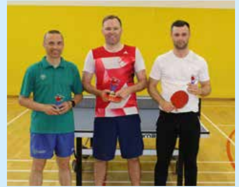
Prvi trije osemnajstega prvenstva