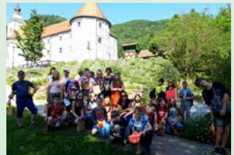
Pred samostanom Olimje v zeliščnem vrtu