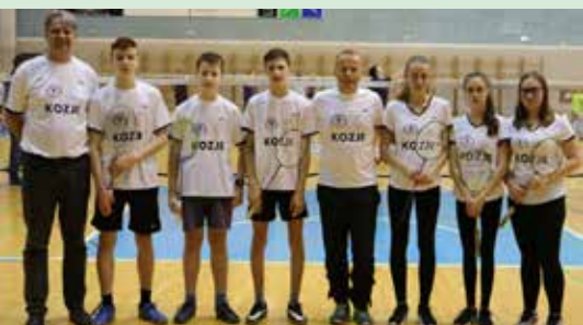
Ekpa OŠ Kozje v Medvodah