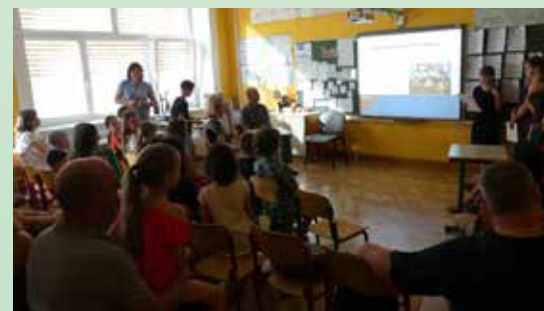
Kdo bi vedel