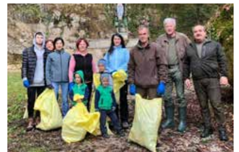
Udeleženci akcije v Zagorju