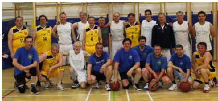
Skupinska slika vseh treh ekip