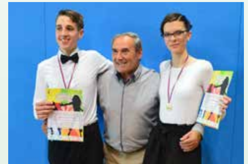
Državna prvaka v plesih z mentorjem

Omenjena učenca sta prejela tudi posebno knjižno nagrado s strani šole in pohvalo za aktivno sodelovanje pri promociji šole, prizadevnost in doseganje vidnih rezultatov na različnih področjih.