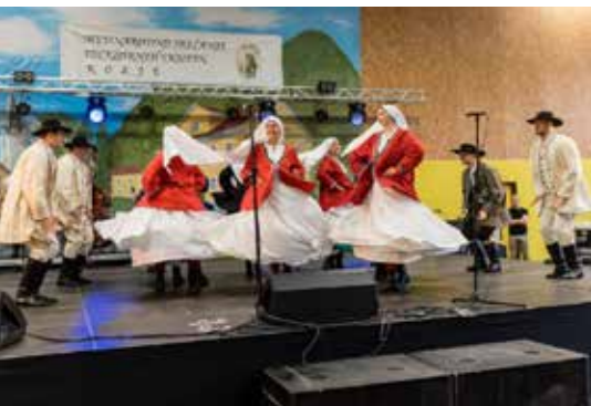
Nastop folklornih gostov