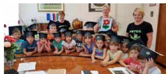
Minimaturanti pri županji