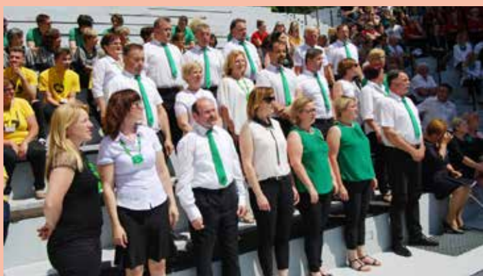
Vinea v Tuhlju

Ob zaključku pevske sezone se je Mešani pevski zbor Vinea Kozje udeležil mednarodnega tekmovanja Zlata lipa Tuhlja . Pevci in pevke so se na vročo poletno soboto, 8. junija, družili z ljubitelji kakovostne zborovske pesmi iz Bosne in Hercegovine, S Hrvaške in iz Slovenije v čudovitem okolju Term Tuhelj ter osvojili častljivo priznanje.