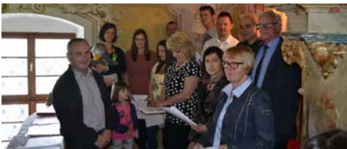
Domači pevci pri maši

V Zagorju se v letu zvrstita dve romanji. Prvo »Zagorsko« romanje je na sedmo velikonočno nedeljo, katero je poznano širši okolici vse do hrvaškega Zagorja, s katerega še danes pride veliko romarjev.