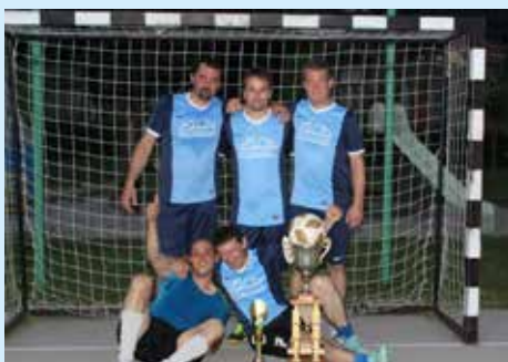
Zmagovalci ŠD Podsreda

Zadnji krog v enajsti sezoni Veteranske lige malega nogometa Market TUŠ Kozje Kozjansko v organizaciji Športne zveze Kozje je prinesel nekaj zanimivosti. V obeh zadnjih dveh tekmah sta se pomerili po ena ekipa iz Občine Kozje in ena iz Občine Podčetrtek in obe tekmi sta neposredno odločali o prvem in drugem ter četrtem in petem mestu. Že pred zadnjim krogom pa je bilo jasno, da bo tretje mesto osvojila ekipa ŠD Bistrica, ki je bila v zadnjem krogu prosta. Ekipi iz Občine Kozje sta potrebovali zmago, da bi prehiteli svoja nasprotnika, ki jima je za ostanek na prvem oziroma četrtem mestu zadoščal že neodločen rezultat. In obema je tudi uspelo zmagati. Tu pa se podobnosti med tekmama končajo. V tekmi med ekipama iz Kozjega in Imenega je padlo namreč ducat golov, dva več so zadeli