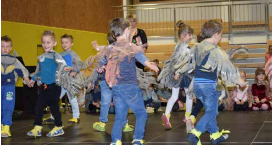
Nastop vrtčevskih otrok

Kaj bi podarila mami, se je spraševala mlada napovedovalka? Iz točke v točko je tako postajalo jasno, da najlepše darilo nastaja na odru z nastopi malih junakov, ki so prav vsem mamam popestrili čudovit materinski dan. Kljub temu da je ob prireditvi, ki je bila v Kozjem v četrtek, od materinskega dne minilo že nekaj dni, pa je bilo vzdušje tisto pravo, čarobno – takšno, kot ga znajo pričarati le najmlajši, ki povedo točno tisto, kar mislijo ... In tako so v pol drugi uri predstavili in povedali številne zgodbe. Mladi folkloristi so plesali, Urban pa je nergal, da je kruh zažgal ... Prav tako so donele številne harmonike, ki so dokazale, da se za prihodnost te zvrsti glasbe ni bati. Niso pa bili le osnovnošolci tisti, ki so zavzeli oder, nanj so prišli tudi ptički iz Vrtca Zmajček, ki so pripravili pravi gozdni radio, ki je s svojimi zgodbami nasmejal prav vse v publiki. Predstavili so se tudi mladi recitatorji, pa mlade pevke, ki so pele ob spremljavi plesalk. Kozjanska šola je dobro poznana tudi po odličnih pevskih zborih, tako sta se na odru predstavila kar dva, otroški in mladinski, in verjemite, peta beseda jim dobro