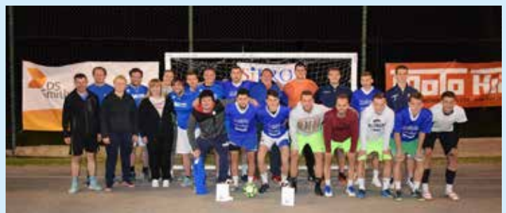
Prve tri ekipe

Po uvodnih jutranjih formalnostih so ekipe z žrebom razdelili v skupine, kjer so nato igrale vsaka z vsako ter po končnem skupinskem delu igrale naprej dvoboje na izločanje. Čudovita vremenska kulisa, napeti in izenačeni dvoboji v četrtfinalih so dali šest ekip, ki so se pomerile za tri mesta v finalu. Tako so si prvo finalno vstopnico pridobili člani ŠD Bizeljsko, drugi so se v finale prebili člani ekipe Metalna Senovo in kot tretji so finalisti postali člani ŠD Oblak. V finalu pa so vse tri ekipe odigrale tekme vsaka z vsako in prav vse tekme so bile izjemno izenačene ter odločene v zadnjih trenutkih ali po kazenskih streljih. Največ spretnosti so prikazali v ekipi ŠD Bizeljsko in se zaslužno razveselili prvega mesta. Tradicionalno dobro so se odrezali tudi člani ekipe Metalna Senovo, ki so