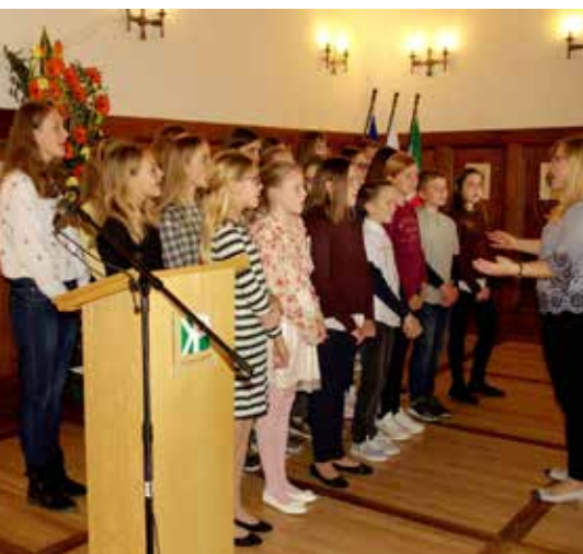
Na svečani seji so nastopili učenci OŠ Kozje