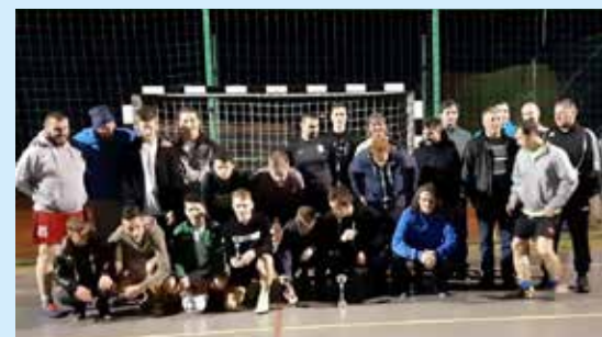
Vsi udeleženci turnirja

Športno društvo Kozje in Športno društvo Rajmax sta zadnjih nekaj let v času prvomajskih praznikov organizirala turnir v malem nogometu, ki pa se ga je v zadnjih letih udeležilo bolj malo ekip, zato so se letos odločili za spremembo in pripravili turnir povabljenih ekip. Na zadnji aprilski dan so na turnirju nastopile ekipe Rajmax, ŠD Kozje mladi, ŠD Kozje veterani in ŠD Bistrica ob Sotli. Kljub ne ravno lepemu vremenu so se ekipe pomerile vsaka z vsako. Po vseh odigranih tekmah je skupno zmago osvojila ekipa ŠD Bistrica, ki je premagala ekipo Rajmaxa in ŠD Kozje mladi, izgubila pa proti ekipi ŠD Kozje veterani. Enak izkupiček, dve zmagi in en poraz, je imela ekipa Rajmax, ki je zaradi poraza v medsebojni tekmi končala na drugem mestu. Po eno zmago in dva poraza sta dosegli ekipi ŠD Kozje mladi in ŠD Kozje veterani in tudi tu je medsebojna tekma odločila, da so mladi končali na končnem tretjem, veterani pa na četrtem mestu. Turnirju je sledilo druženje v Športnem parku Kozje, kjer ni manjkalo dobre volje. (R.G.)