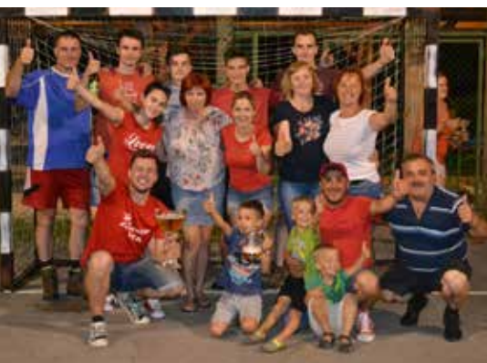
Zmagovalna ekipa iger