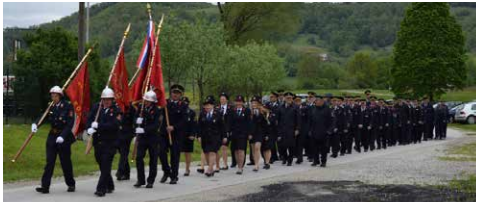
Parada sodelujočih gasilcev