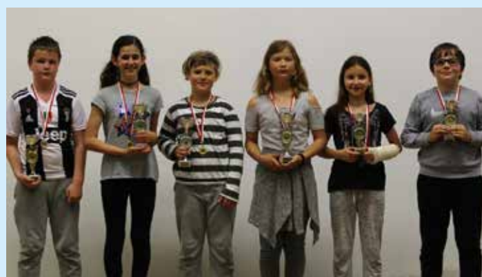
Najboljši skupno med učenci in učenkami do 12 let

Bor se je s tretjim mestom zavihtel tudi med najboljše tri fante do 12 let v seštevku vseh štirih turnirjev. Osvojeno četrto mesto v No-