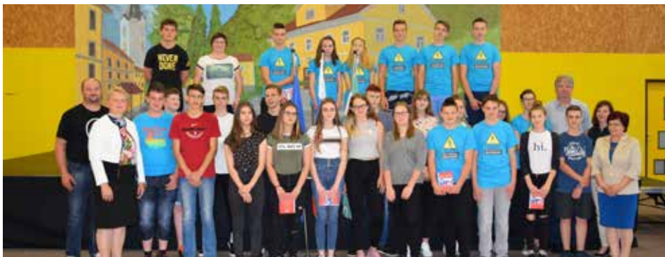
Devetošolci iz Občine Kozje