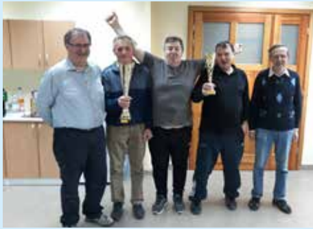
Zmagovalci DU Senovo

Gostitelj šestega turnirja so bili prvaki prve sezone, ekipa Športnega društva Bistrica ob Sotli. Na turnirju je sodelovalo pet ekip, manjkala je le ekipa ŠD Kozje mladi. Ekipa Društva upokojencev Senovo si je naslov prvaka praktično zagotovila že pred zadnjim turnirjem, kljub temu pa je bila tudi tokrat zanesljivo najboljša, saj je zmagala na vseh štirih tekmah. Na drugem mestu so zadnji turnir končali člani ŠD Bistrica