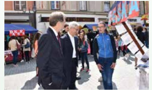
Minister in evropski poslanec pri ogledu naše stojnice

Sladkosnedni obiskovalci so lahko okusili babovko, češko pecivo, podobno marmornemu kolaču, tisti, ki imajo raje izzive, pa so poskusili ali pa celo sestavili češko sestavljanko. Iz Češke pa prihajajo tudi številni risani junaki. Enega smo oživili tudi mi. Krtek je vabil obiskovalce k stojnici, se z njimi fotografiral ali jim namenil pozdrav. Občudovali so ga mladi in tudi nekoliko starejši, ki so se spomnili na čas otroštva in ogleda njegove risanke. Bilo je zanimivo in zabavno. Pozitivna izkušnja, ki bi jo z veseljem še kdaj ponovila. Mogoče se pojavi priložnost, kdo ve?!