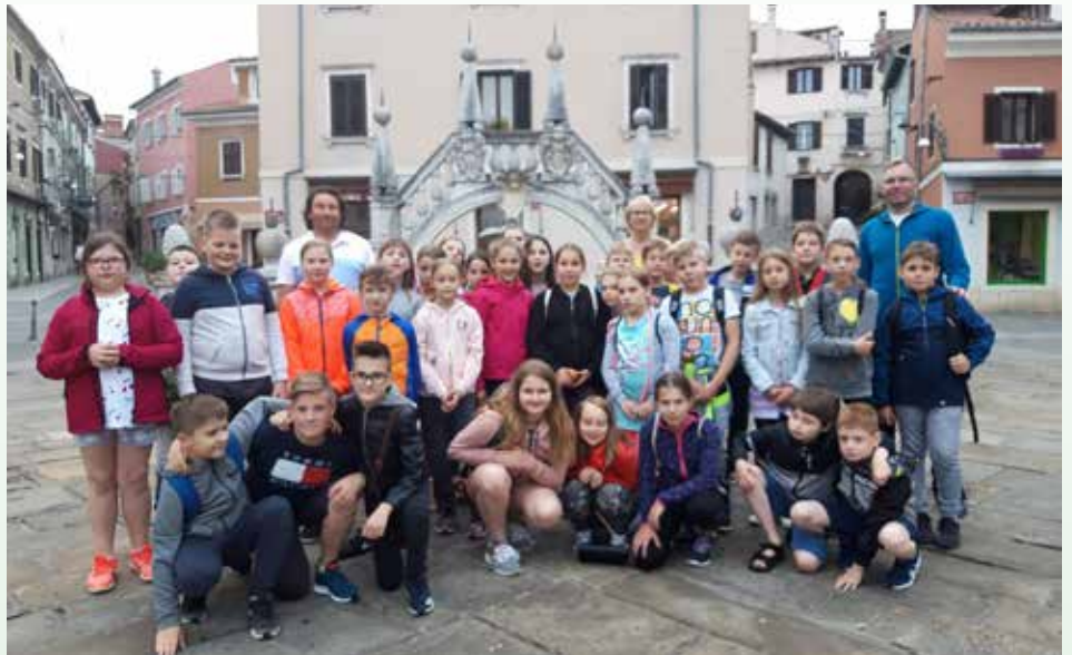
Skupinska pred Da Pontijevim vodnjakom

Zadnji dan v petek smo na plavanju delali, kar smo hoteli. Všeč mi je bilo, ko smo šli v akvarij in ko smo v akvariju videli majhne morske pse.