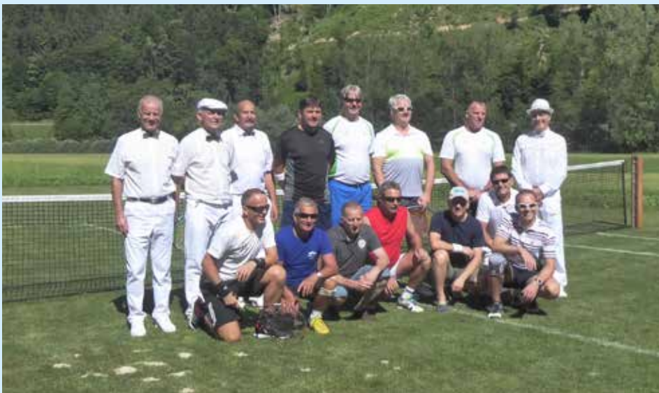
Obe ekipi na travnatem igrišču

Po uvodnem pozdravu in okrepčilu so nam razkazali dvorec Visoko, nato pa je vsaka izmed dvojic odigrala po eno tekmo na travnatem igrišču. Nato smo se vsi skupaj predstavili v Gorenjo vas, kjer smo odigrali še preostalih dvanajst dvobojev. Vsako ekipo namreč sestavljajo štiri dvojice in vsaka odigra po štiri tekme, skupno torej šestnajst dvobojev. In na petem srečanju smo se Kozjani prvič veselili zmage.