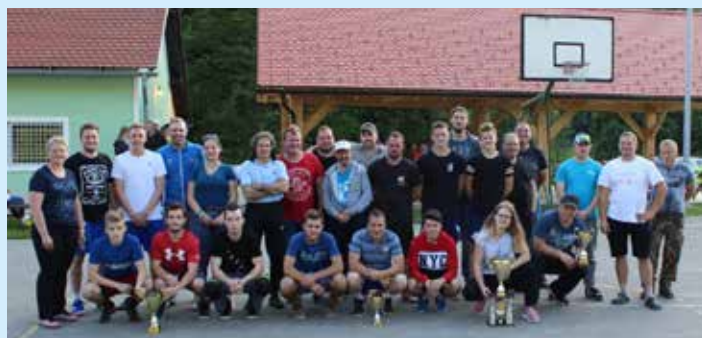
Člani prvih treh ekip

Zadnji dve disciplini nista prinesli sprememb na samem vrhu končne razvrstitve, sta pa prinesli zamenjavo na tretjem mestu. Vodilni ekipi ŠD Kozje in ŠD Lesično sta se v teh dveh disciplinah uvrstili v spodnjo polovico sodelujočih, vendar sta imeli pred zasledovalci že preveč prednosti. Razlika med vodilnima ekipama je ostala enaka in za trideset točk se je druge skupne zmage veselila ekipa ŠD Kozje. Ekipa ŠD Lesično je še drugič osvojila drugo mesto, pa tudi na tretjem mestu je ista ekipa kot lani, ekipa ŠD Buče. Lani se je na zaključnem tekmovalju na tretje mesto prebila s četrtega mesta, letos pa celo s petega. Zmaga v vleki vrvi in drugo mesto v nogometu sta prinesla dovolj točk, da so na četrto mesto potisnili ekipo ŠK Virštanj.