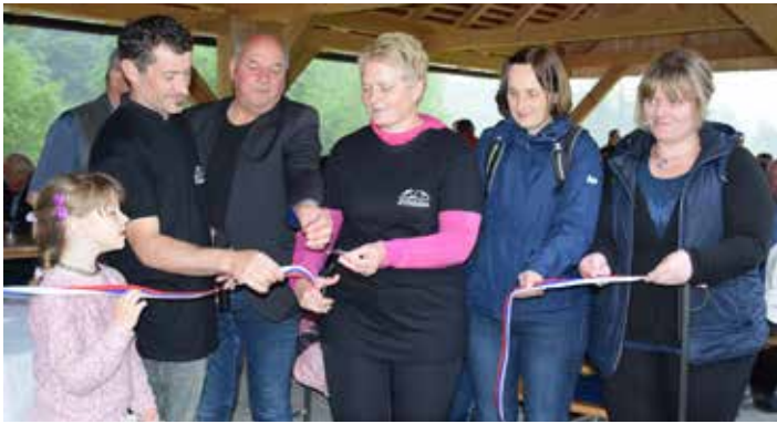
Svečani prerez traku

Šport, tako pomembna dejavnost, bodisi prostočasna, bodisi profesionalna. Prav vsak pa se je vsaj kdaj ukvarjal s to dejavnostjo, ki krepi zdrav način življenja v zdravem telesu. Tega so se v Podsredi začeli zavedati zgodaj in se odločili, da športno aktivne domačine združijo pod eno streho, v obliko društva. Sprva kot TVD Partizan Podsreda , nato pa je društvo dvajset let kasneje dobilo novo ime, ime, ki ga ponosno nosi še danes, Športno društvo Podsreda . Letos so člani, simpatizerji, prijatelji in podporniki društva štiri desetletja neprekinjenega delovanja društva slavnostno obeležili, v duhu športa tako kot se za športnike spodobi, ob tej priložnosti pa so namenu predali še nov prireditveni kozolec, ki zaokrožuje športni park Podsreda v prekrasno celoto, ki nudi številne možnosti preživljanja prostega časa .