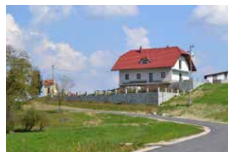
Sanacija plazu na Klakah

Berglezu v Kozjem), izgradnja kanalizacije in čistilne naprave v Lesičnem 391.420 €, oskrba s pitno vodo 107.3555 € (sanacija cevovodov Buče–Verače, gasilski dom Buče, Zeče, Topla, Zagorje in Klak), sanacija plazu na Klakah in v Zagorju 163.397 €, nabava nove gasilske