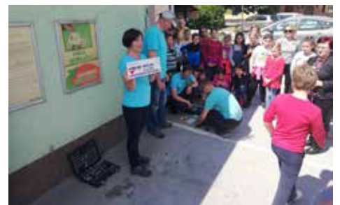
V Lesičnem so namestili ploščico za višino vode