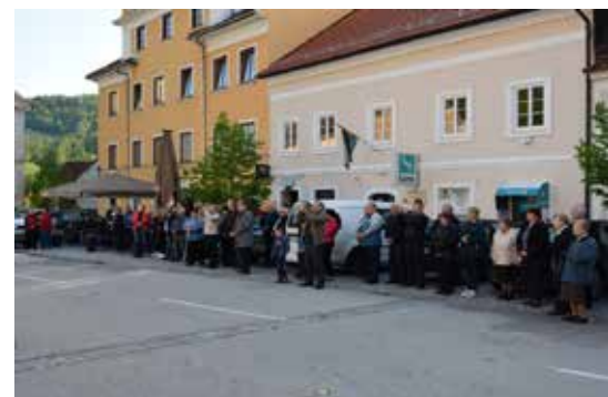
Nastop na trgu v Kozjem