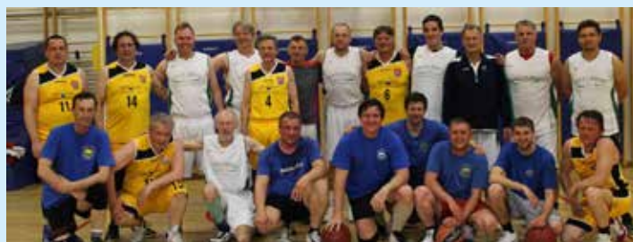
Skupinska slika vseh treh ekip