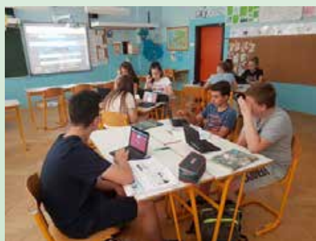
Pouk geografije s programom Quizzez

V petletni projekt je vključenih 75 vzgojno-izobraževalnih zavodov, med katerimi je 20 razvojnih, ostali pa so implementacijski. Kot rezultat projekta bodo nastala tudi priporočila za razvoj podpornega okolja. V projekt je kot implementacijska šola vključena tudi naša Osnovna šola Lesično.