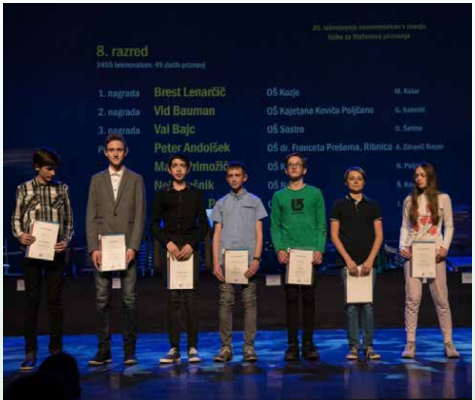
Sestkratni državni prvak Brest na prireditvi Mladi bistroumi