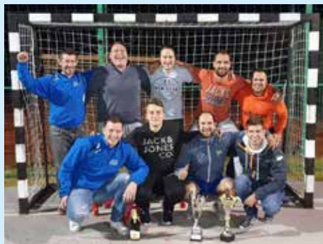
Prvaki ŠD Podsreda

S tekmami 14. kroga se je zaključila jubilejna dvajseta sezona Lige malega nogometa Kozjansko v organizaciji Športne zveze Kozje, ki je letos potekala pod imenom LMN Market TUŠ Kozje Kozjansko. Letošnja sezona je bila tudi prva, ki je potekala v dveh koledarskih letih, prvi del jeseni 2018 in drugi spomladi 2019.