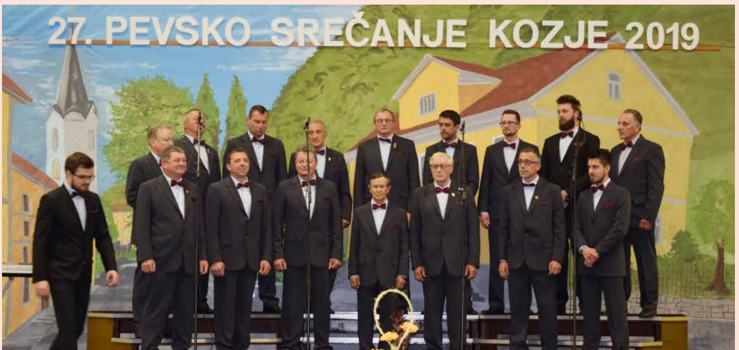
Člani MoPZ Kozjanski park so bili odlični gostitelji