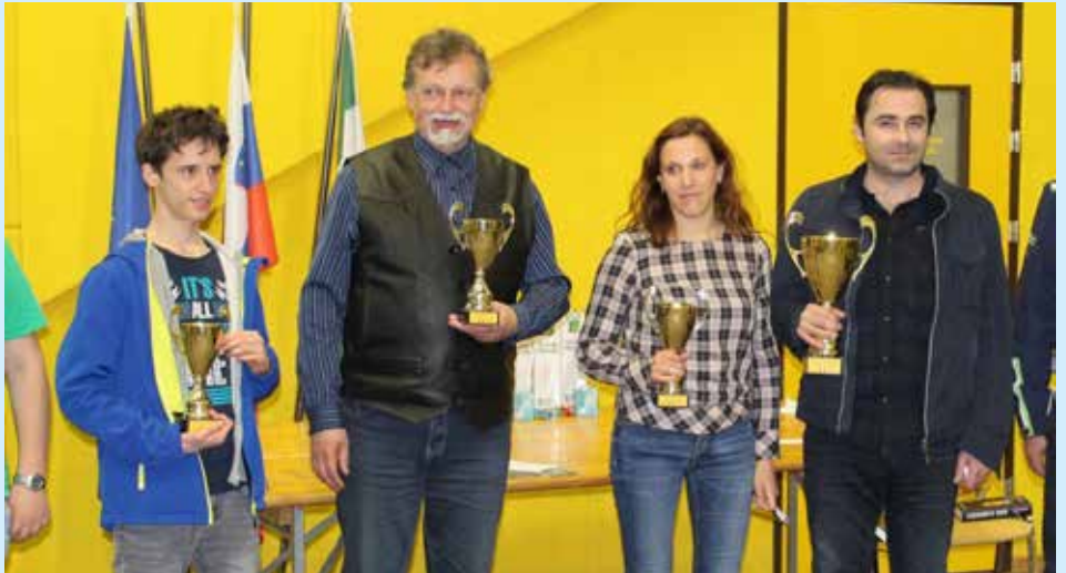
Najboljši mladinec, senior, šahistka in zmagovalec turnirja