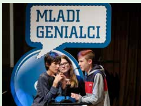
Naša ekipa med tekmovanjem

V sredo, 24. aprila, se je v Krškem odvijalo že sedmo tekmovanje Mladi genialci. Med triindvajsetimi osnovnimi šolami iz Posav-